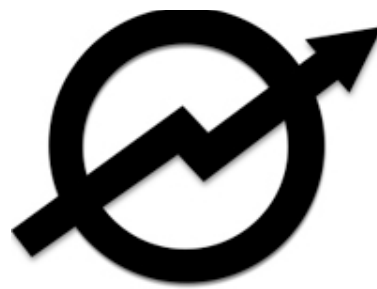
Symbool van de krakersbeweging